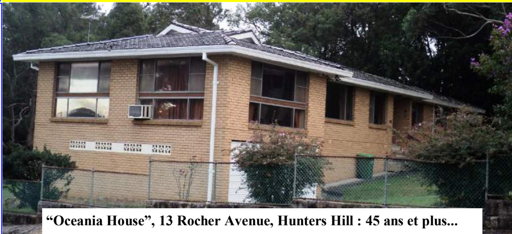
“Oceania House”, 13 Rocher Avenue, Hunters Hill : 45 ans et plus...